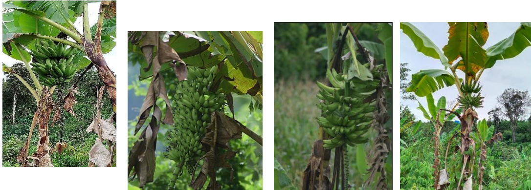
Gambar 1. Musa acuminata diploid AA