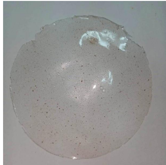
Gambar 1. Tampilan fisik edible film

atas beberapa tahapan, seperti pembersihan, perendaman, penyaringan, pencucian, pengendapan, dan pengeringan. Proses ekstraksi pati secara basah ini menghasilkan rendemen sebanyak 8%.